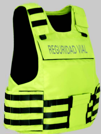
YVA022 Высота Зрение Дорожной Полиции Жилет