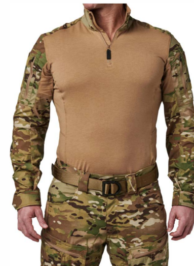
■ Футболка Multicam Быстро Долго Стив Рубашка