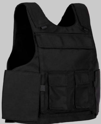
YVA014 Азер резать штатную перевозчика