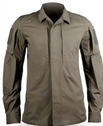
■ Рубашка С Длинным Рукавом