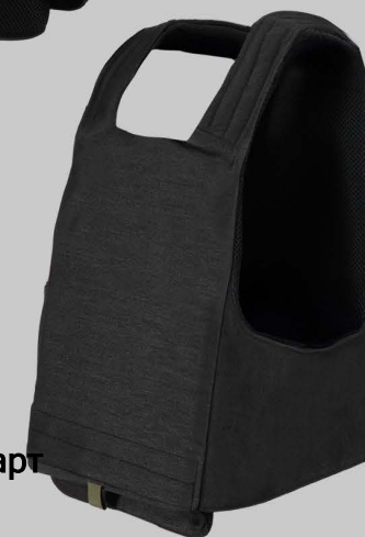
YVA017 Женский Стандарт Жилет