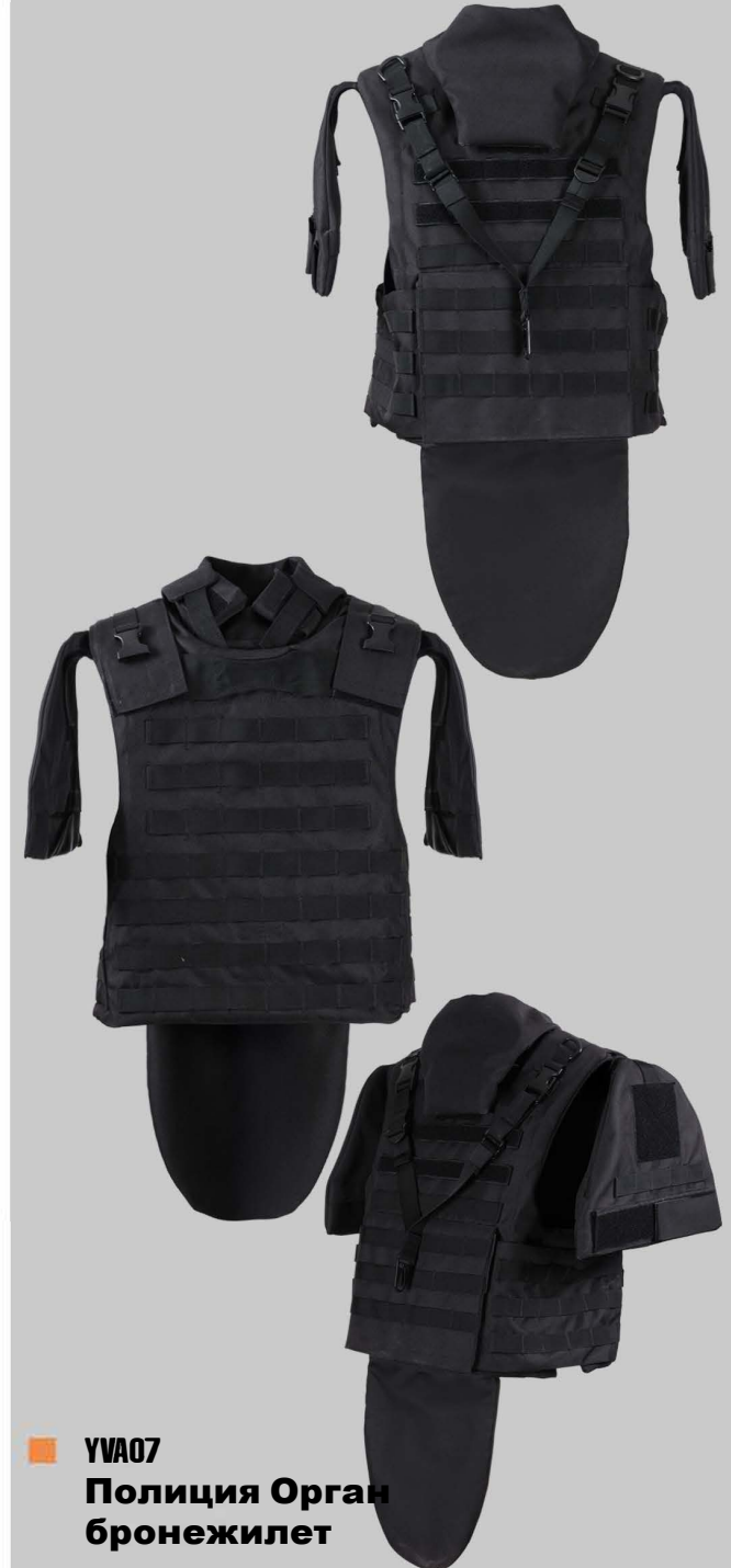
■ YVA07 Полиция Орган бронезилет