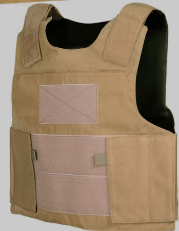
YVA019 Липучки Стандартной Системы Жилет