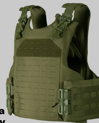
■ YVA011 Лазерная Резка Модель Карьеру