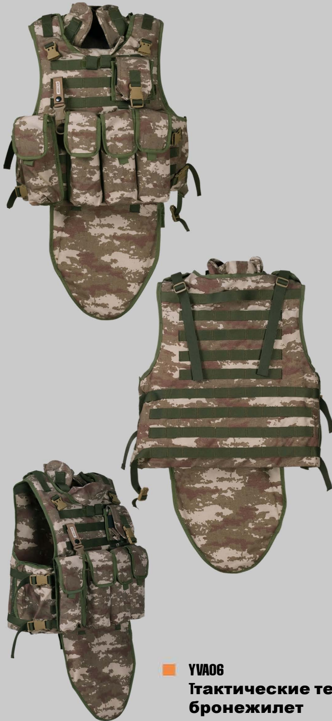
■ YVA06 Тактически тела бронезилет