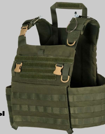
YVA09 Выстрел-Системы Карьеру