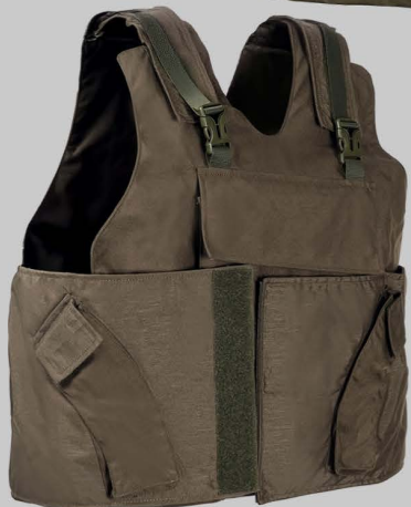
YVA018 Большой стандартный размер жилет