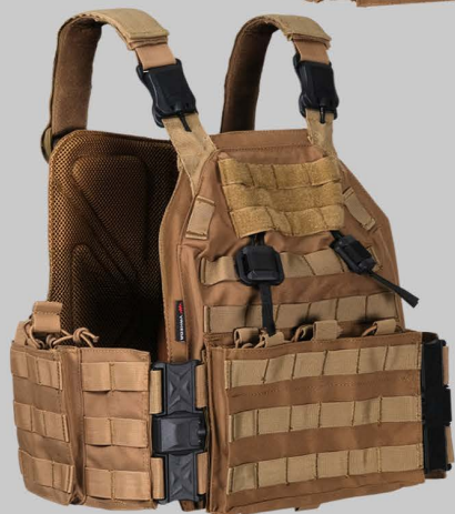
■ YVA010 E Аварийные Открытые Транспортных Систем