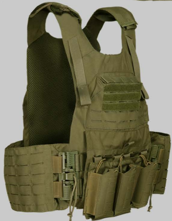
■ YVA020 Лазерная Резка Мешков Курьером