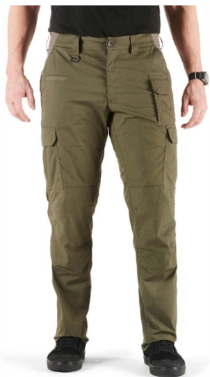
■ Корго тактические брюки зеленый-черный- Браун ЛК Гелен ссылке