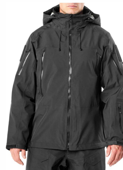
■ Водонепроницае мая куртка