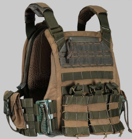
YVA08 Профессиональную Карьеру