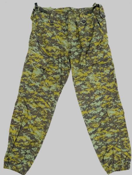
■ Ребра стоп % 50 хлопок % 50 Полиэстер Униформа Размер Размеры XS-S-M-L-XL- XXL-XXXL осенняя