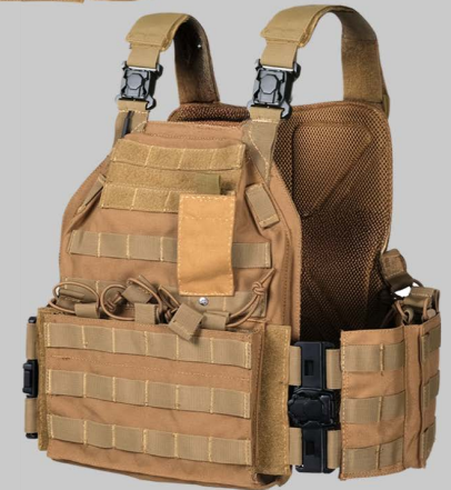
■ YVA021 ЧП "Открытые Системы"