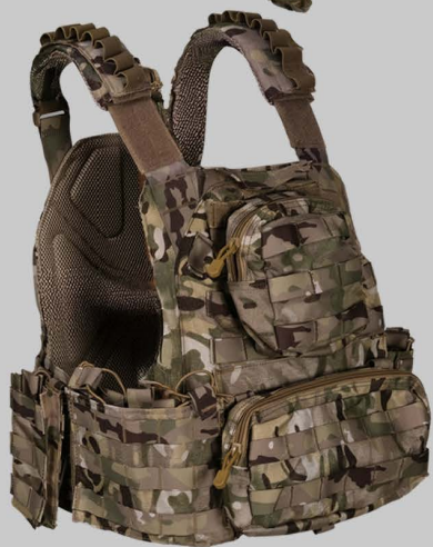
YVA016 Мульти кулачок ткань Мульти Подсумки Перевозчика