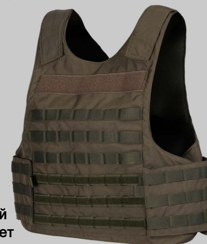
YVA013 Стандартный Одноместный Жилет