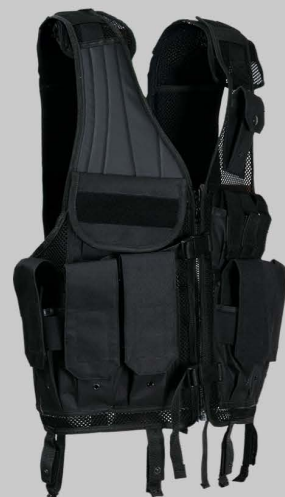
YVA012 Тактическая Полицейская Операция Жилет