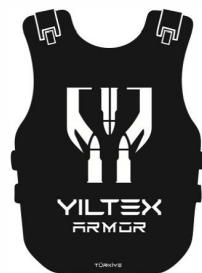
КОПУРА ТКАНЬ 500 DN / 1000 DN