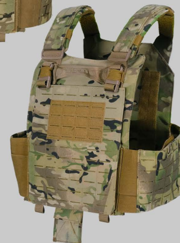
YVA015 Полиция Стандартный Жилет